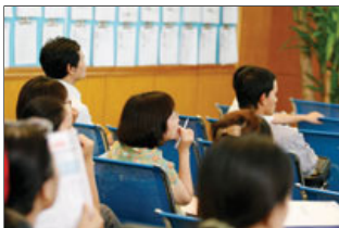
Sức ép thị trường sẽ buộc các công ty đại chúng phải cải thiện báo cáo tài chính, chứ không chỉ báo cáo thường niên để thu hút nhà đầu tư.

Sau hàng loạt vụ bê bối tài chính những năm cuối thế kỷ 20, đầu thế kỷ 21 như Enron, WorldCom, Tyco International, Adelphia... gây tổn thất khoảng 500 tỷ USD giá trị thị trường trong giai đoạn 2000 - 2002, những nhà điều hành và giám sát thị trường Mỹ đã đề ra Đạo luật Sarbanes-Oxley vào năm 2002, được xem là đạo luật cải cách chế độ kế toán của công ty đại chúng và bảo vệ NĐT.